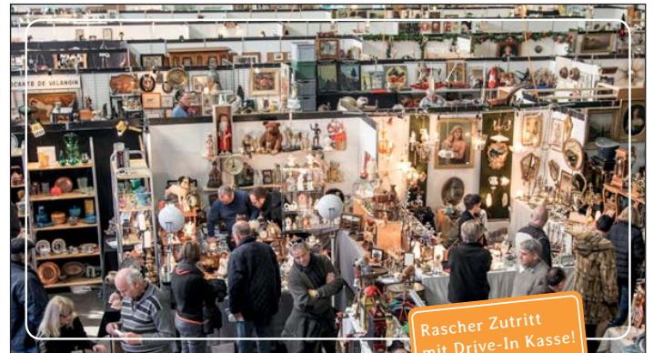
Rascher Zutritt mit Drive-In Kasse!

Antike Puppen- & Bären-Reparaturen in Museumsqualität durch Frau Rosmarie Kunz, international ausgezeichnete Puppenfachfrau. Besuchen Sie ihre Kurse für malen und modellieren im art-center 2555 Brügg-Biel, intrex@bluewin.ch oder www.intr-ex.ch Tel. 032 373 43 49 12